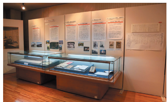
《昨年度の特別展の様子》