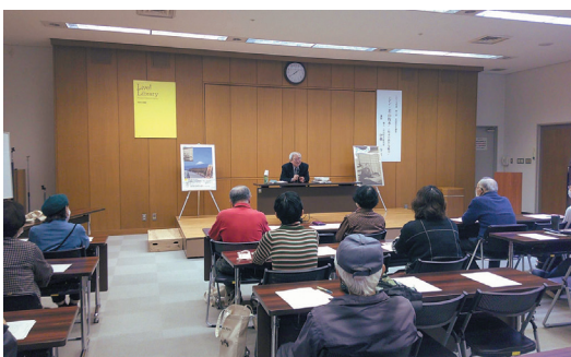
《昨年度の文化講座の様子》

※今年度中に計画しておりました企画展「南国イメージの旅 宮崎観光の自叙伝」(仮)は諸般の事情により中止とし、別の企画展を準備中です。詳細につきましては、後日当館ホームページにてお知らせいたします。