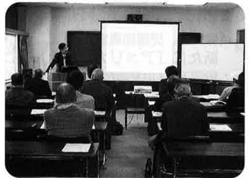
〈特許活用セミナーの様子〉