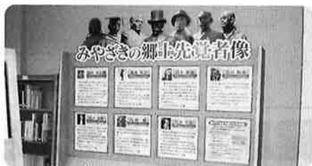
〈郷土の先人たちパネル〉