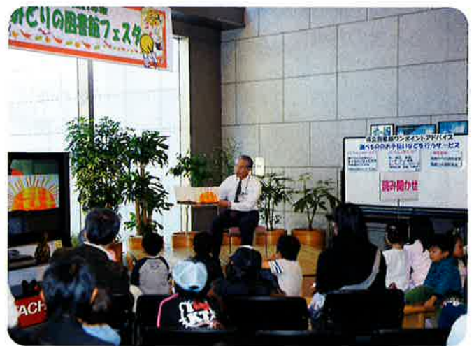
〈みどりの図書館フェスタの様子〉

宮崎県立図書館が、人づくり・地域づくりに役立つ図書館として、積極的に活動している「動」の姿勢を、ビジュアル的に表現したものです。