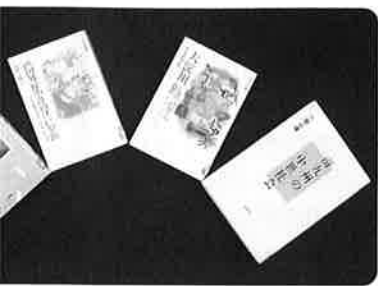
〈みやざきの歴史の本〉