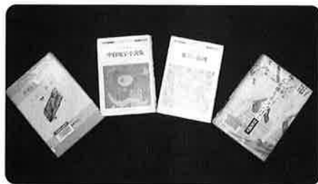
〈みやざきの100冊の本〉