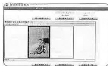
〈デジタルアーカイブイメージ〉