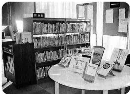
〈健康情報コーナーの様子〉