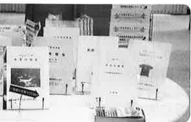
〈みやざきの行政資料〉