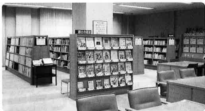
〈郷土資料室の様子〉

具体的には、宮崎県内の歴史や自然、伝統芸能などの本、小説歌集・同人誌のような文学に関する本、宮崎の食べ物、観光情報誌、写真集などがあります。