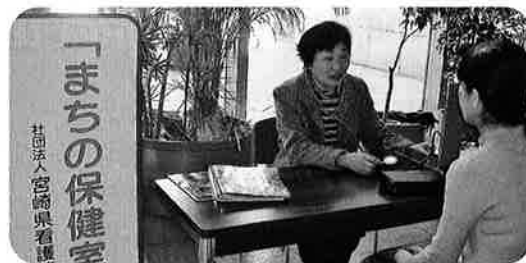
〈「まちの保健室」の様子〉