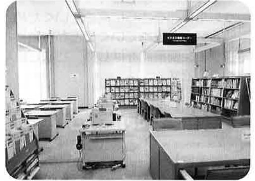
〈ビジネス情報コーナーの様子〉