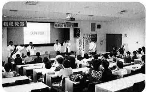
〈関連講座「租税&社会検定」の様子〉