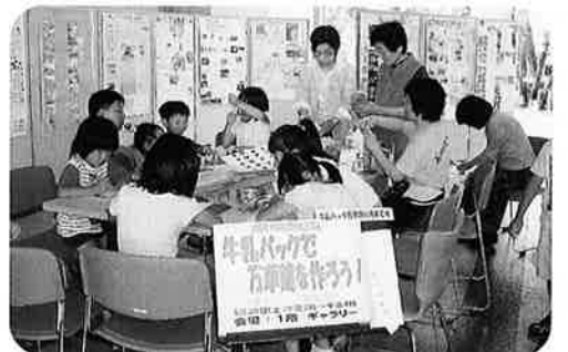
〈関連講座「牛乳パックで万華鏡を作ろう!」の様子〉