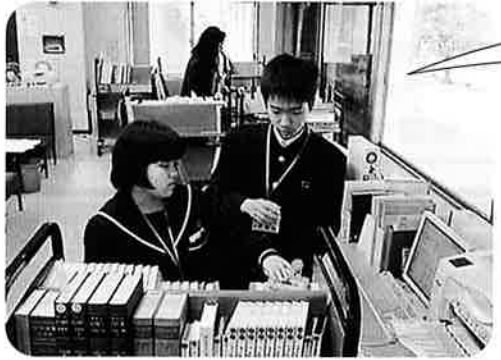
〈職場体験学習の様子〉

私は、県立図書館で職場体験学習ができて本当によかったと思います。人と接する面ですごく難しいところがあったけど、司書の方々のアドバイスがすごく勉強になりました。 この体験学習は、学校では学ぶことのできないことを勉強させていただきました。教えていただいたことを日頃の生活に生かしていきたいです!!