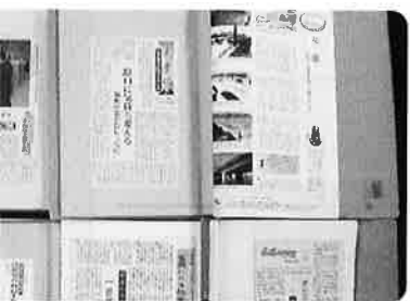
〈新聞切り抜きファイル〉