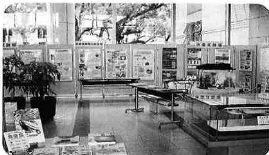
〈企画展示「農畜水産業夏休み特別企画展」の様子〉

県立図書館1階ギャラリーやロビーでの企画展示のほか、関連講座もありますので、ぜひお気軽にご参加ください。