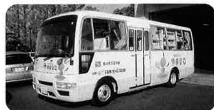
〈「やまびこ」号の様子〉

平成21年度は県内45(うち特別支援学校13校)の学校を年に3回ずつ巡回し、約3万冊の貸出を行っています。