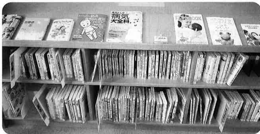
〈子育て支援コーナーの様子〉