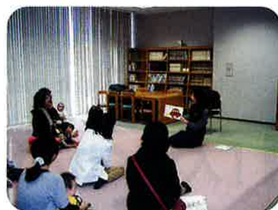
〈読み聞かせの様子〉