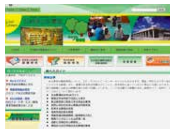
県立図書館ホームページ

県立図書館ホームページ「レファレンス（調査相談）」→「調べ方ガイド」もありますので、どうぞご利用ください。