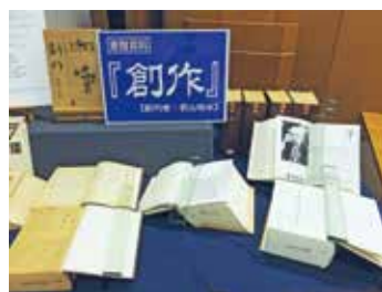
若山牧水創刊 短歌雑誌「創作」の寄贈