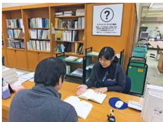
レファレンス（調査相談）サービス