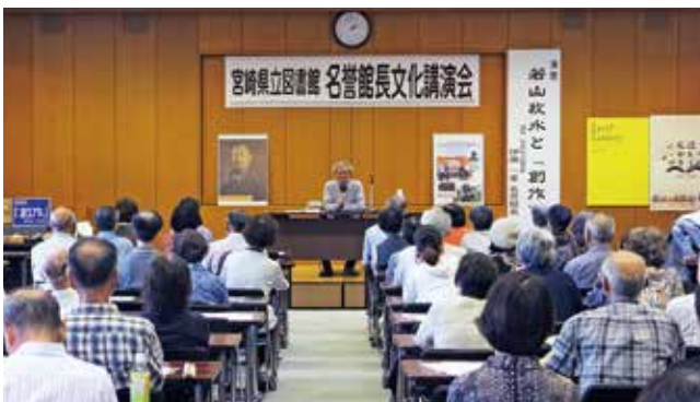
名誉館長文化講演会