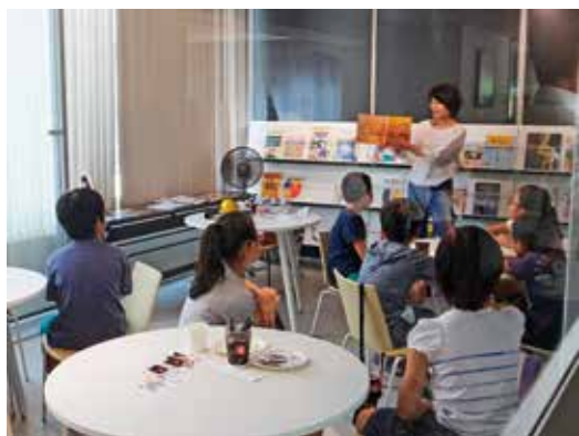
科学の本の読み聞かせと理科の実験を融合させた「理科読」授業