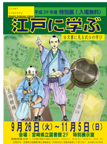
特別展「江戸に学ぶ」