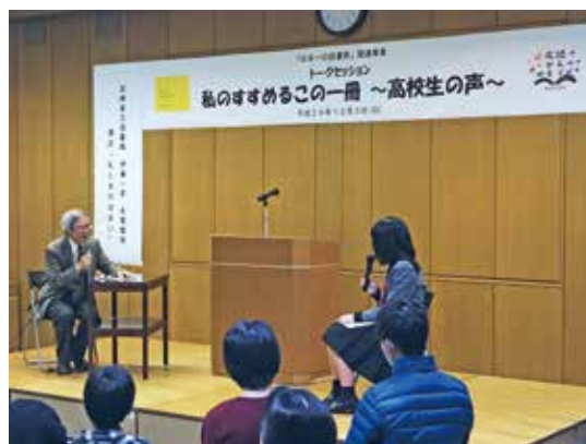
「私のすすめるこの一冊～高校生の声～」トークセッション