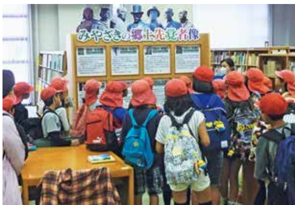
郷土資料室（小学生の社会見学）