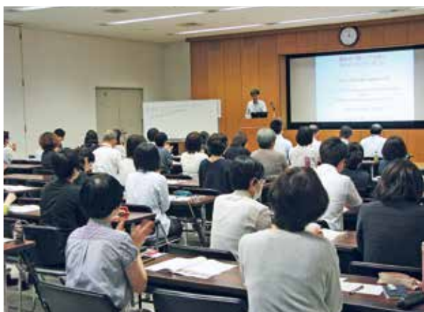
公共図書館連絡協議会研修