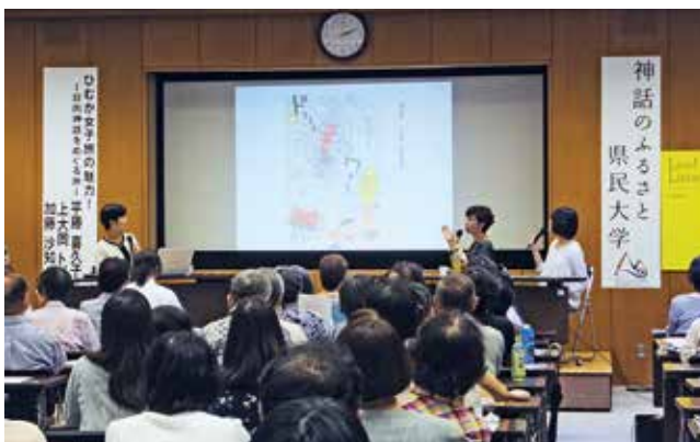
神話のふるさと県民大学