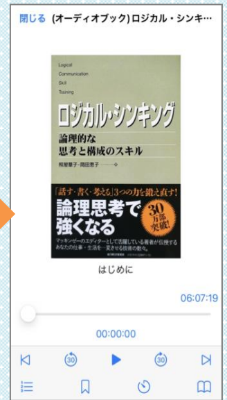
オーディオブック視聴画面