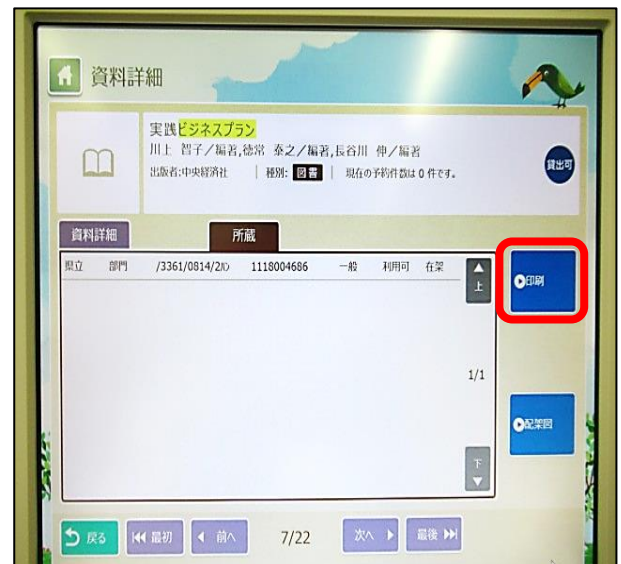
④ 印刷をクリック (タッチ) するとシートが印刷されます