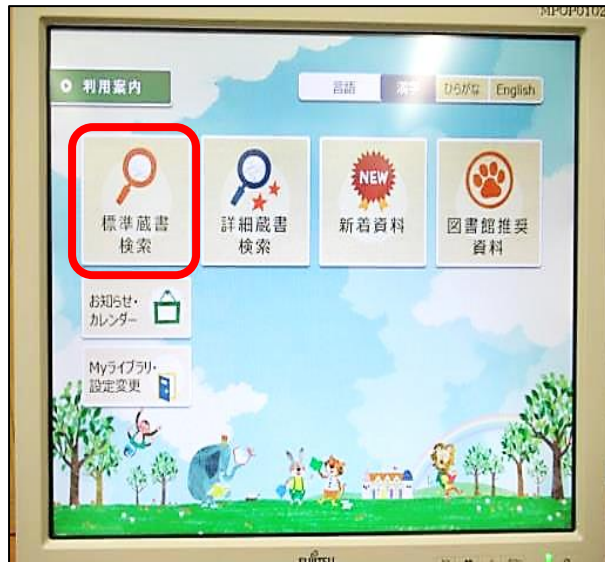
① 標準蔵書検索をクリック (タッチ) します