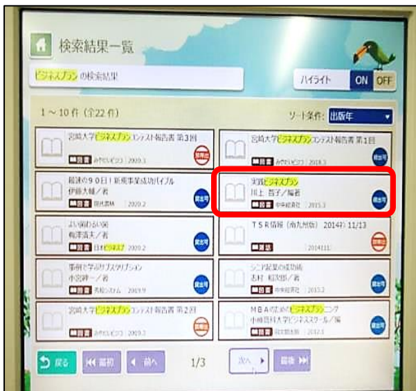
③ 読みたい資料をクリック (タッチ) します